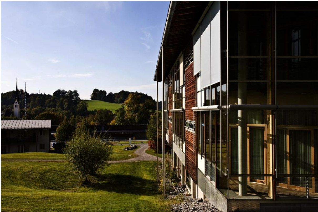
Abbildung: kbo-Lech-Mangfall-Klinik Agatharied